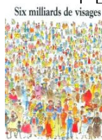
Six milliards de visages

Pour les chants, voir le site « Chantons en Eglise »