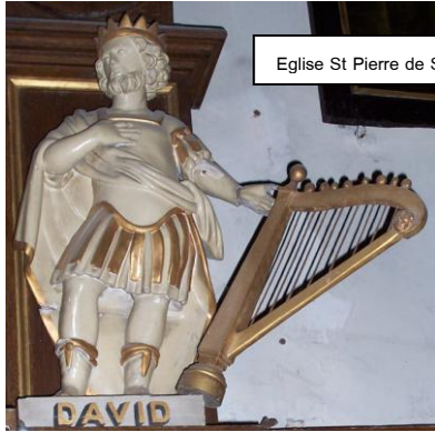
Eglise St Pierre de Steenbecque