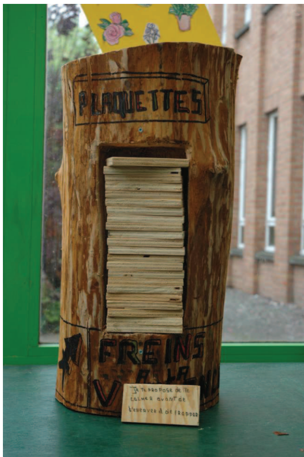
Les plaquettes de Frein à la violence.