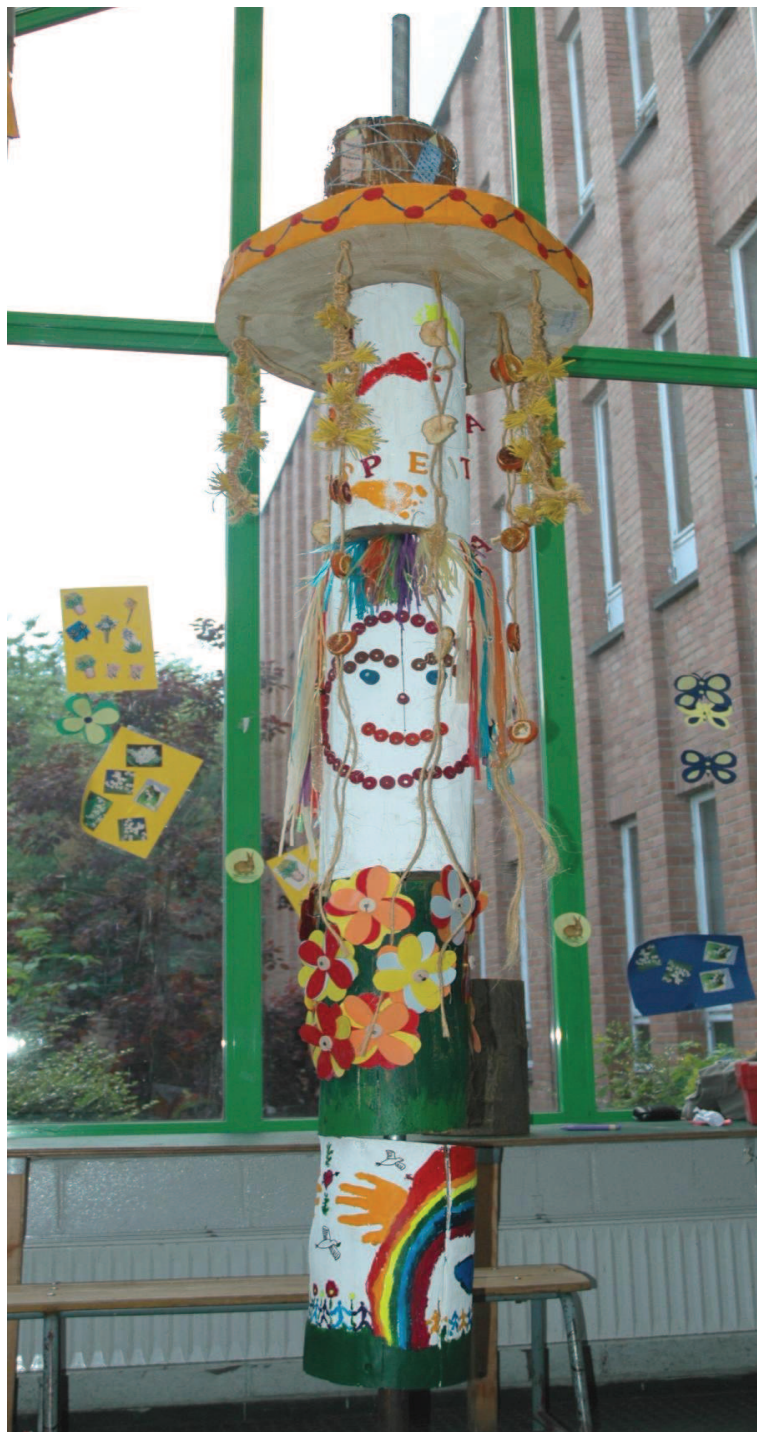
TOTEM DU CHEMIN DES BOIS