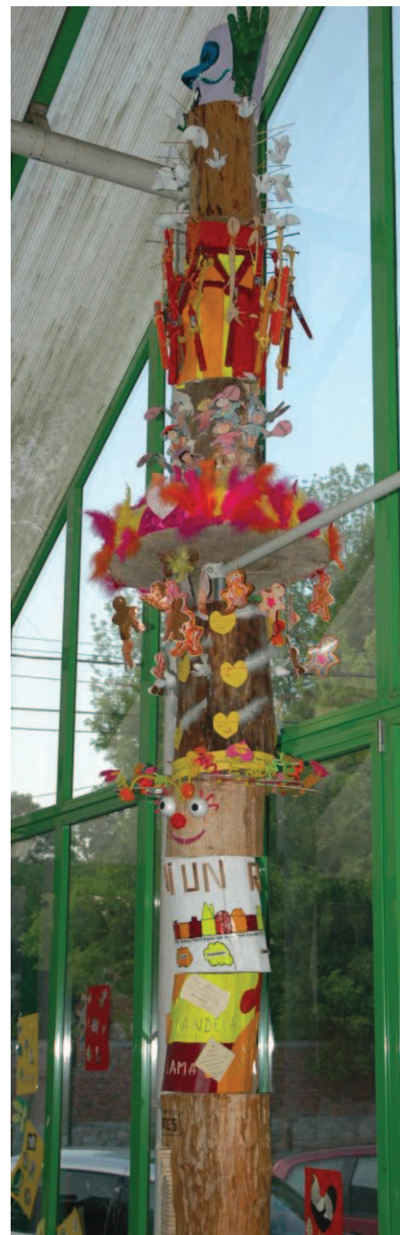
TOTEM DU CHEMIN DE MONS