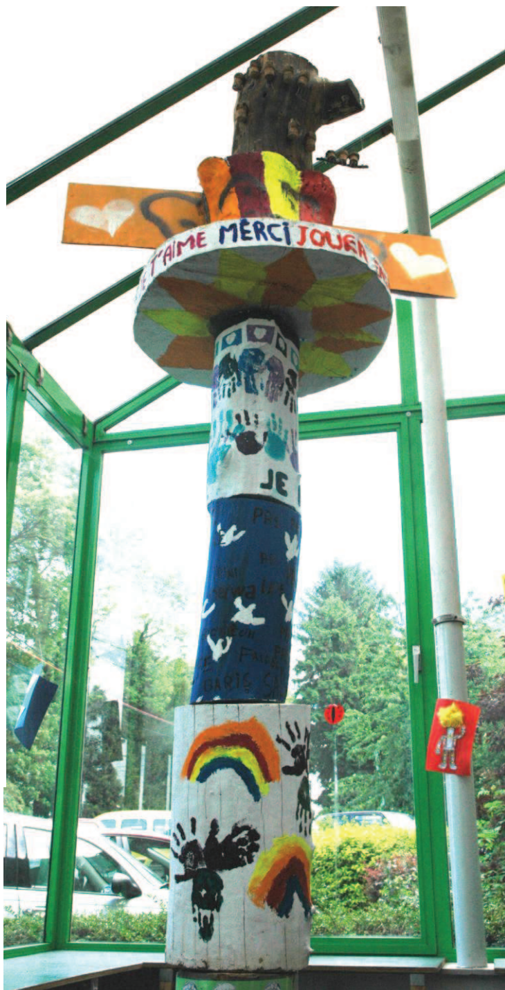
TOTEM DU VIEUX CAMPINAIRE